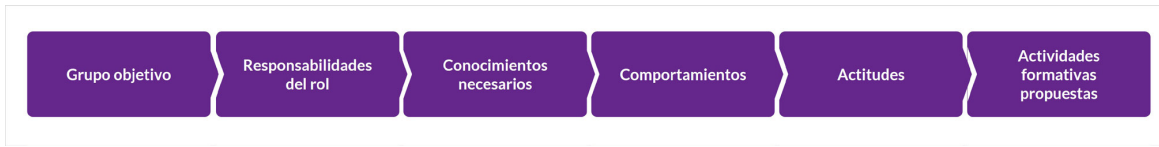
Cuadro N°2. Matriz de competencias para el sistema de gestión NCh3262

Nota: Elaboración propia Ars Global Consultoría.