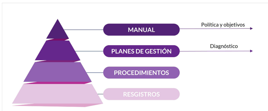
Estructura documental de un sistema de gestión basado en la Norma Chilena NCh3262:2021

Nota: Elaboración propia Ars Global Consultoría.